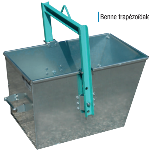
Benne trapézoïdale 90 L