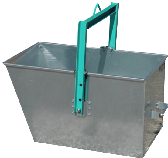
Benne trapézoïdale 120 L