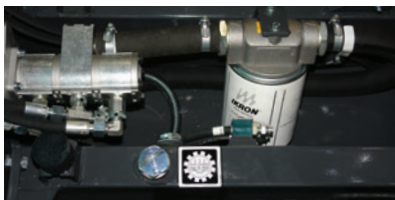
Réservoir d'huile hydraulique incorporé au châssis

Le CARRY 107 est un mini-transporteur hydrostatique compact. Il est équipé d'un circuit hydraulique auxiliaire permettant d'ajouter des accessoires hydrauliques. Le montage de la benne est simple. Il est également possible de remplacer la benne par d'autres accessoires (autres modèles de bennes; petites bétonnières ...). Il existe en 2 versions : Essence avec moteur HONDA GX 270 6.3 kW, ou version Diesel avec moteur YANMAR L100 7.4 kW.