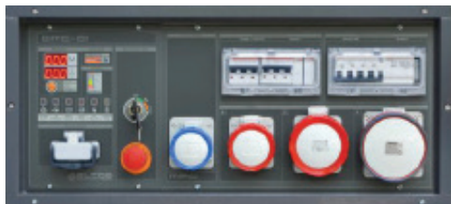
Tableau de commande à bord QMC version (+12)