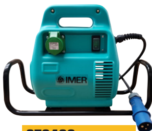
ST0488 VERSION LUGE