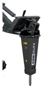
MARTEAU DE DÉMOLITION