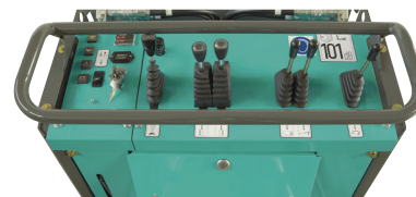
Console de contrôle et commandes intuitives