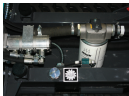
Réservoir d'huile hydraulique incorporé au châssis