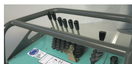
Console de commandes

Large ouverture du capot moteur pour faciliter l'entretien