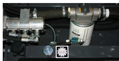
Réservoir d'huile hydraulique incorporé au châssis