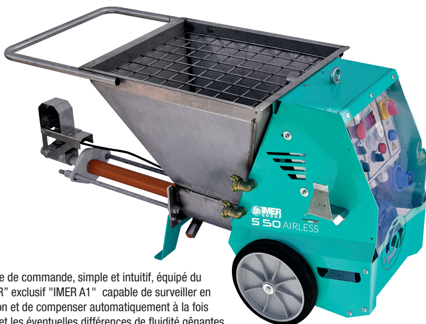
Tableau électrique de commande, simple et intuitif, équipé du nouvel "INVERTER" exclusif "IMER A1" capable de surveiller en continu la pression et de compenser automatiquement à la fois l'usure du stator et les éventuelles différences de fluidité gênantes entre un mélange et l'autre, assurant toujours une pulvérisation homogène maximale.

L'affichage indiquant la vitesse de la pompe et la pression de fonctionnement a également une fonction de diagnostic, capable de signaler automatiquement toute anomalie pendant l'utilisation et les méthodes d'intervention relatives.