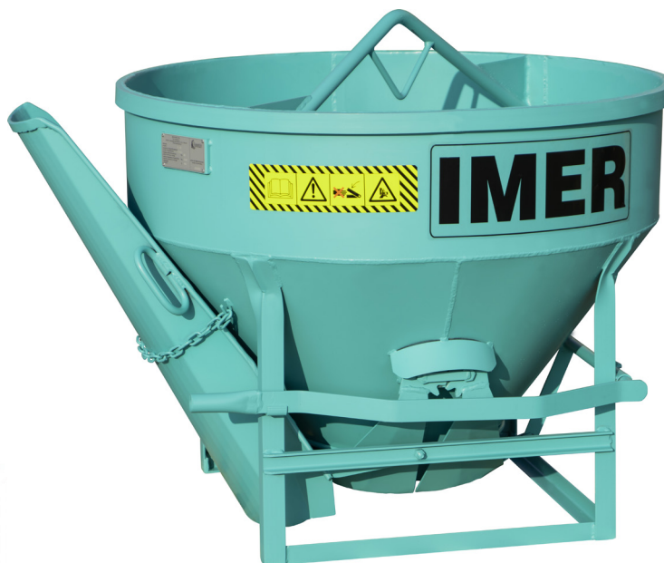
Benne conique levier simple Goulotte non amovible